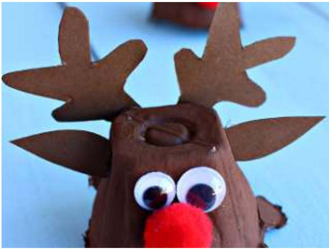
( _files/view.php/resize/1920x1080/blogpost/10/56729ad9186a7.png )