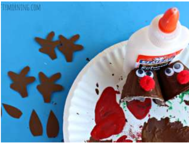
( _files/view.php/resize/1920x1080/blogpost/10/56729ade11b05.png )