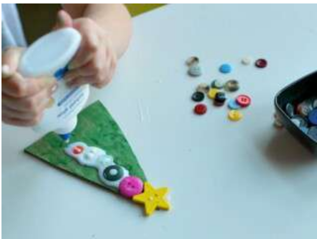
( _files/view.php/resize/1920x1080/blogpost/10/56729ac8bf2cf.jpg )