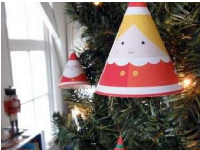
( _files/view.php/resize/1920x1080/blogpost/10/56729ad17cae2.jpg )