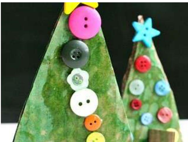
( _files/view.php/resize/1920x1080/blogpost/10/56729acde8a66.jpg )